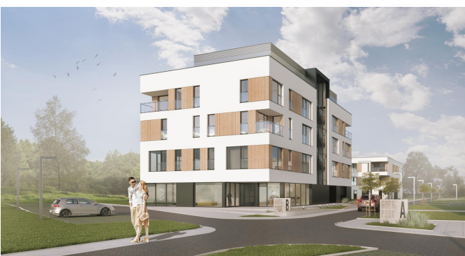
BUDYNEK B Mieszkanie 5