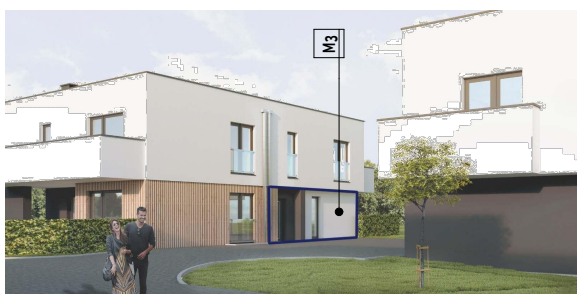
RYBNIK - KASKADA Segment W Mieszkanie 3